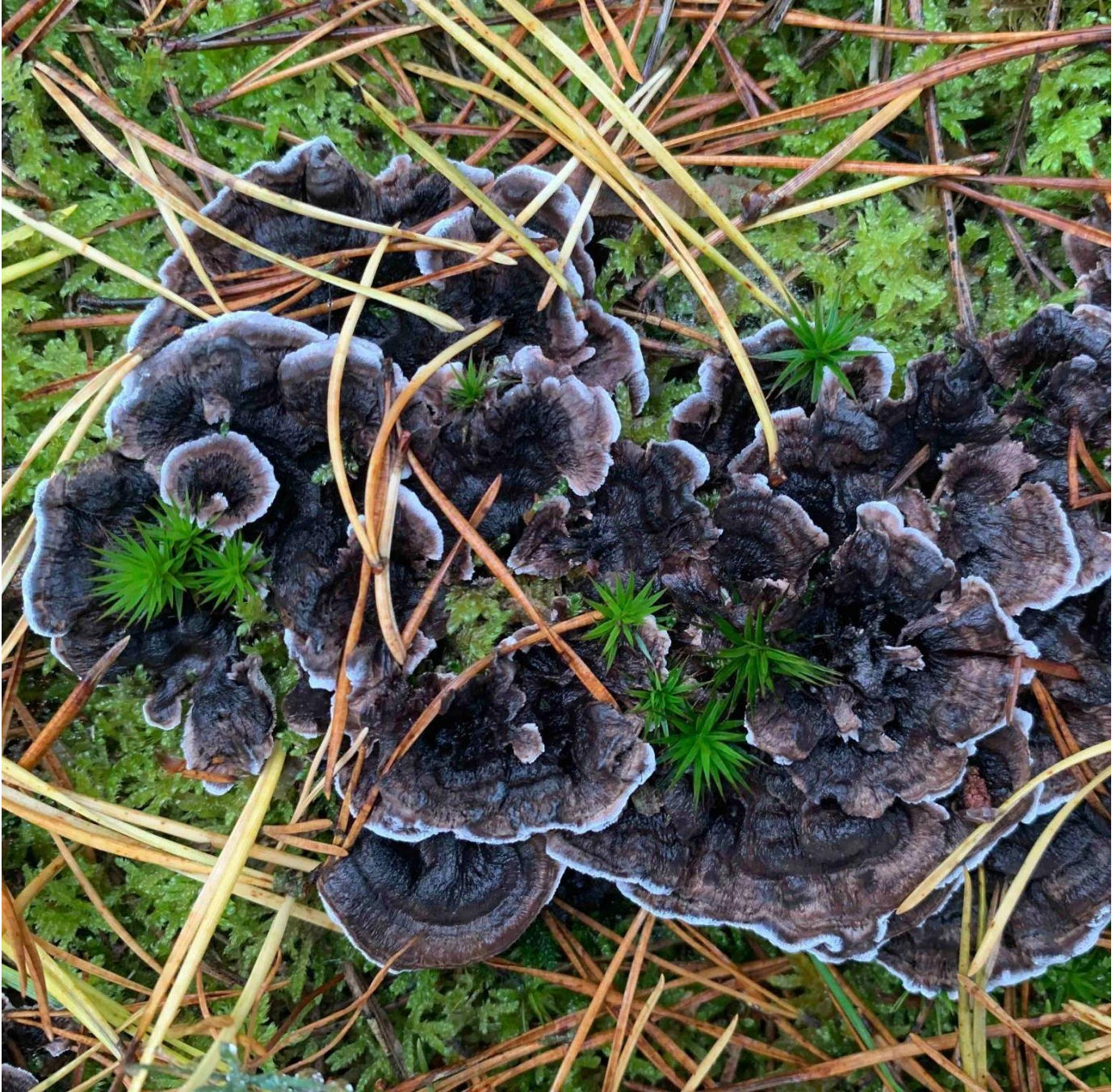
Phellodon connatus