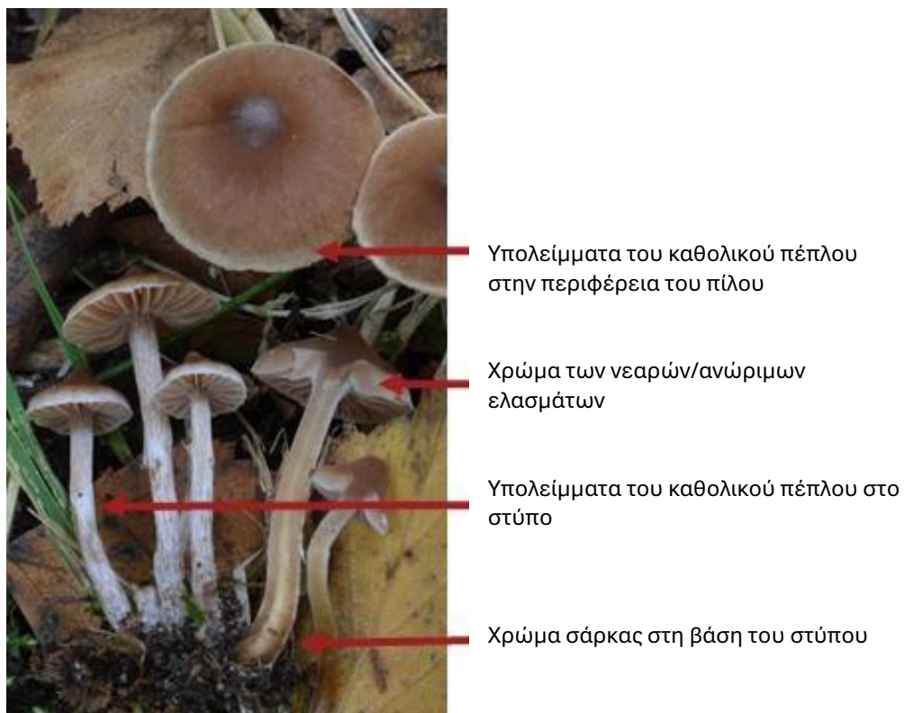
Εικ. 2. Σημαντικοί, αλλά συχνά παραγνωρισμένοι χαρακτήρες πεδίου στους Κορτινάριους ( Cortinarius minusculus )

Οι κορτινάριοι χαρακτηρίζονται από ένα σκωριόχρωμο-καφέ αποτύπωμα σπόρων, σπόρια με τραχιά επιφάνεια και εκτομυκορριζική διαβίωση. Πέραν αυτών των χαρακτηριστικών όμως, διαφέρουν πολύ ως προς το σχήμα, τα χρώματα, τις διαστάσεις και τη δομή της επιφάνειας του πύλου και του στύπου (Εικ. 2). Τα περισσότερα είδη φέρουν ένα ευδιάκριτο μερικό πέπλο σαν ιστό αράχνης όταν είναι νεαρά (για αυτό και η ονομασία στα αγγλικά “web-caps”). Επίσης πολλά διαθέτουν ένα καθολικό πέπλο που αφήνει περισσότερο ή λιγότερο ευδιάκριτες ίνες, λέπια, ζώνες ή κηλίδες στην περιφέρεια του πύλου, καθώς και στο κατώτερο μέρος του στύπου σε υπό ανάπτυξη καρποφορίες (ή στο περιθώριο του βολβού στα είδη στα οποία ο πύλος αυξάνει σε διάμετρο πριν από την επιμήκυνση του στύπου ή και κατά μήκος του στύπου στα είδη όπου αυτός επιμηκώνεται πριν από την πλήρη ανάπτυξη του πύλου).