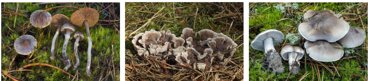
Εικ. 1. Αντιπρόσωποι των τριών ομάδων-στόχων (από αριστερά): Cortinarius fusisporus , Phellodon connatus και Tricholoma sudum

Στο έργο FunDive ο κύριος στόχος είναι η συλλογή μανιταριών που σχετίζονται με τη δασική πεύκη ( Pinus sylvestris ) και τα μαυρόπευκα (σύμπλοκο ειδών περί το Pinus nigra ), ενδιαφέρουν όμως και είδη μυκήτων που σχετίζονται με άλλα είδη πεύκων. Με βάση την υπάρχουσα γνώση, τα είδη μυκήτων που χρήζουν προστασίας σχετίζονται πρωτίστως με μεγαλύτερης ηλικίας πευκοδάση, σε ισχυρά ασβετώδη ή εξαιρετικά φτωχά, αμμώδη εδάφη. Τα συγκεκριμένα ενδιαίτηματα αποτελούν βασικό στόχο για τις δειγματοληψίες στο πλαίσιο του έργου FunDive. Επιπλέον, για τις ομάδες ειδών που ορίζονται ως στόχοι της δειγματοληψίας, συλλογές και από άλλα ενδιαίτηματα είναι επιθυμητές για να διαλευκανθούν ταξινομικά ζητήματα.